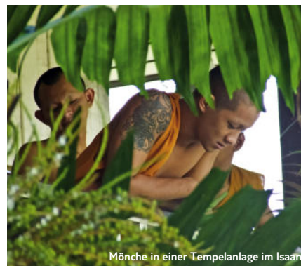
Mönche in einer Tempelanlage im Isaan