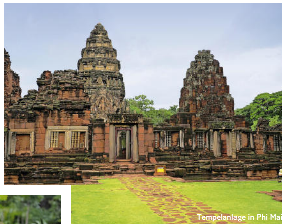
Tempelanlage in Phi Mai

Auf dieser Reise gibt es immer wieder Neues und Aufregendes in den bislang vom großen Tourismus verschonten Regionen des Isaans zu entdecken. Lassen Sie sich einfangen vom Charme der Menschen, dem ländlichen Leben rund um die endlosen Reisfelder dieser bildhübschen Region und den wechselnden Landschaften. Ihre Tour führt Sie vom ältesten Nationalpark Thailands über steinerne Zeugen des Khmer Angkor Reiches im Geschichtspark Phi Mai und in die Provinz Surin bekannt für die Züchtung der Seidenraupe und Fertigung von edlen Stoffen, bis an die Ufer des mächtigen Mekong Flusses in Nong Khai, der Grenzstadt zu Laos.