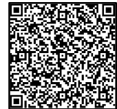
Datum Bangkok, 05.02.2014