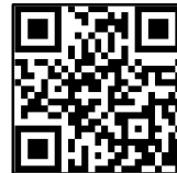
Unser Zeichen 4Wheel.travel